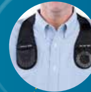
Den Ladekragen oder und das dazugehörige Gegengewicht